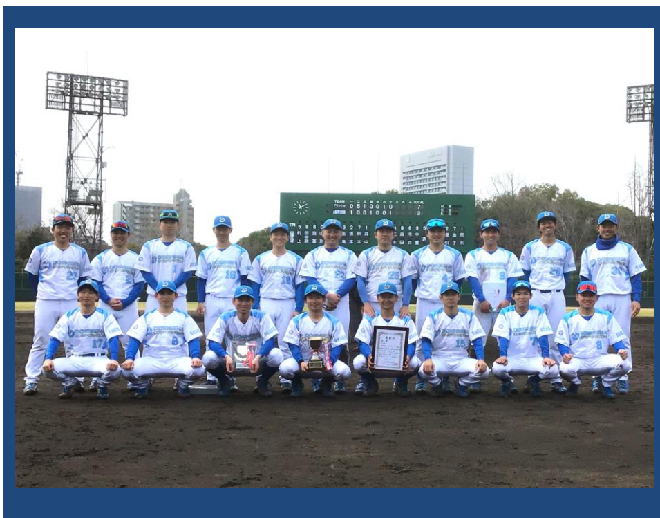
優勝 株式会社ドウシシャ（特待）